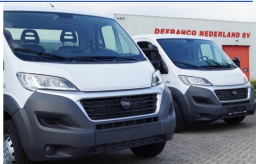
Diverse cabines beschikbaar