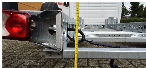
Ultra lage instap - 25 cm!

Het lage chassis maakt een instap op slechts 25 cm hoogte mogelijk. Wel zo gemakkelijk met in- en uitstappen. En het bevordert uw kampeerplezier!