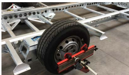
6-Wiel laser uitlijning

Alle wielen worden uitgelijnd met Josam® laser-apparatuur. Standaard op elke Coxx X-Low.