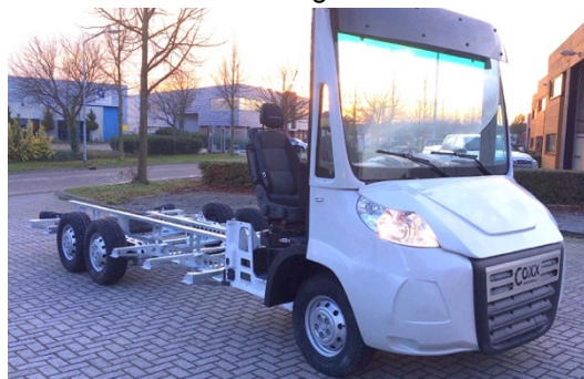
Shortcab integraal cabine

Bent u benieuwd naar wat Coxx Mobile Systems voor u kan betekenen? Neem dan contact met ons op voor een vrijblijvend gesprek.