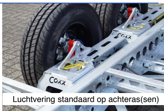
Luchtvering standaard op achteras(sen)

De luchtvering is eenvoudig bedienbaar met de bijgeleverde touchscreen bediening. Deze werkt zeer intuïtief, zoals een smartphone.