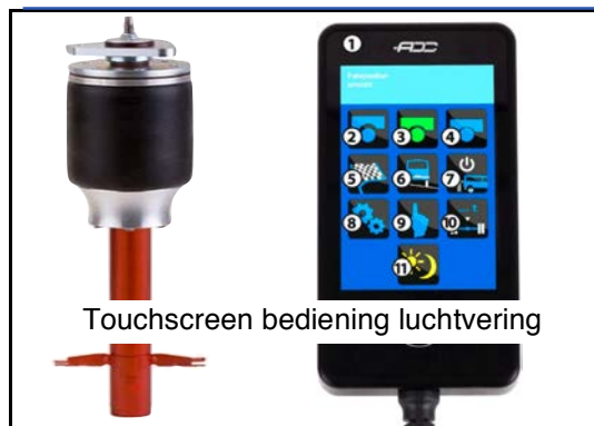
Touchscreen bediening luchtvering

Optioneel is er luchtvering op de vooras beschikbaar. Dit 4-kanaals systeem biedt u extra rijcomfort en maximaal draagvermogen op de vooras.